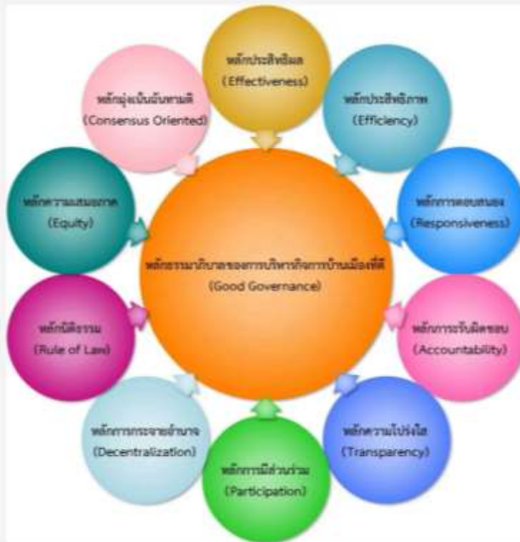
งานบุคคล กลุ่มอำนวยการและงบประมาณ